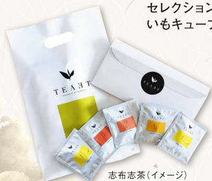
志布志茶(イメージ)

国際的な品評会で評価されている鹿児島県産のフレーバーティー「TEAET」と航空会社のCAセレクションで1位を獲得したこともある「キャラいもキューブ」をご用意。