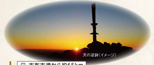
天の逆針(イメージ)

旬の食材を味わう和会席です。鹿児島県の伝統工芸品である薩摩焼や意匠を凝らした器と共に、台の物はかつお汁で食べる黒豚のしゃぶしゃぶをお楽しみください。