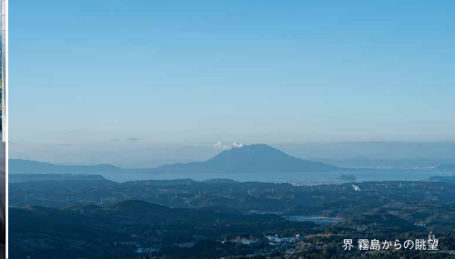
界霧島からの眺望