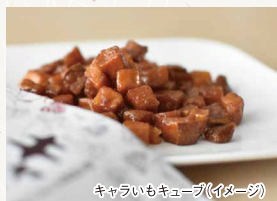
キャラいもキューブ(イメージ)