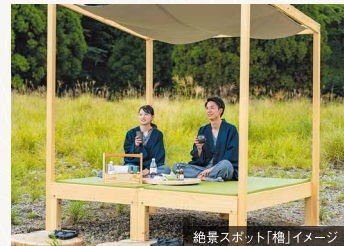
絶景スポット「櫓」イメージ

鹿児島弁で「お茶を一杯」という意味の茶いっぺ。季節に合わせた選りすぐりの霧島茶と、地元の和菓子職人の方が界霧島から見える絶景をモチーフに創作した和菓子のセットをご用意します。