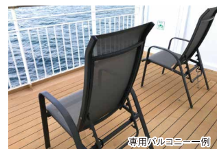
専用バルコニー一例

まるでホテルのような、広々とした贅沢な空間です。専用のバルコニーでは、太平洋を臨みながら、ゆったりとした上質な時間を過ごせます。非日常の船旅を心ゆくまでご堪能ください。