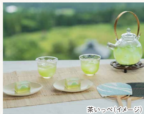
茶いっぺ(イメージ)

茶いっぺは客室以外でも楽しめます! お気に入りの絶景スポットを見つけて気分を解放