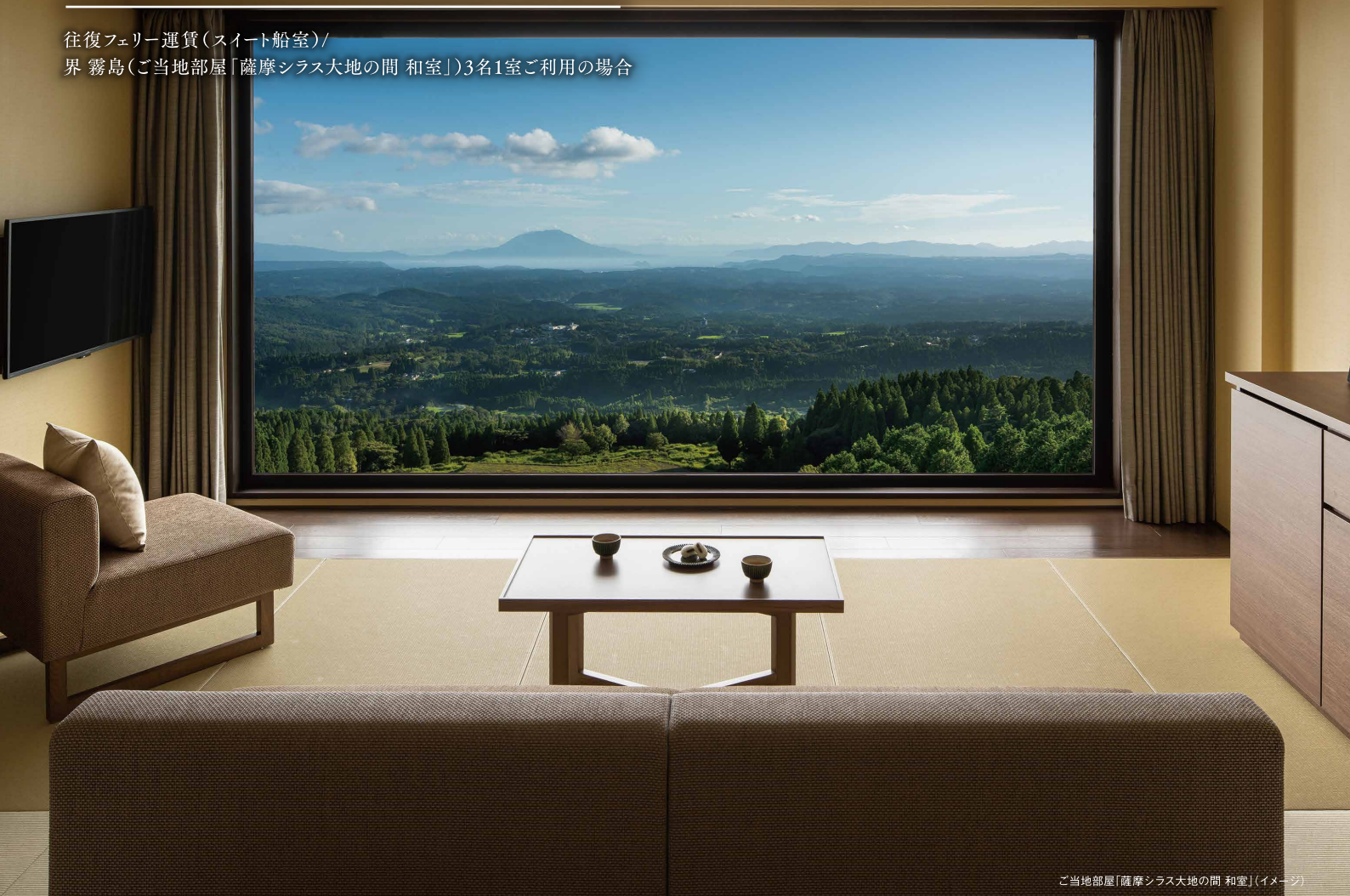
ご当地部屋「薩摩シラス大地の間 和室」(イメージ)