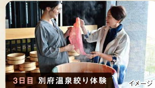
3日目 別府温泉絞り体験 イメージ