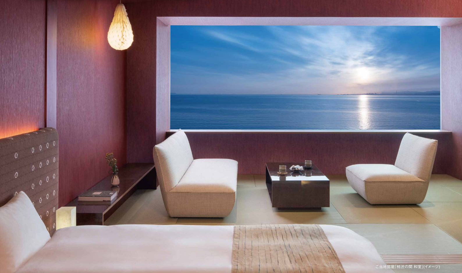
ご当地部屋「柿浜の間 和室」(イメージ)