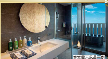
客室露天風呂一例

高層階に位置する温泉の露天風呂が付いたお部屋です。一面の窓や露天風呂からは朝陽が昇る様子もお楽しみいただけます。