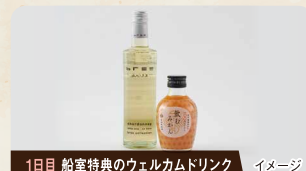
1日目 船室特典のウェルカムドリンク イメージ