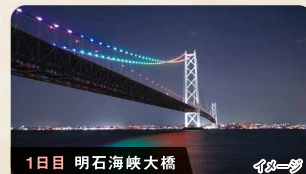
1日目 明石海峡大橋 イメージ