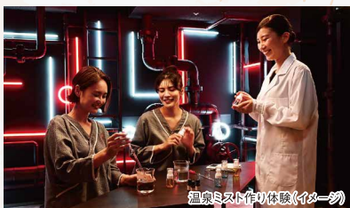
温泉ミスト作り体験(イメージ)

また、別府を知り尽くした温泉まち歩き名人が登場し、別府の歴史やおすすめの観光スポット、悩みに合わせた湯めぐりの提案などを聞くことができます。