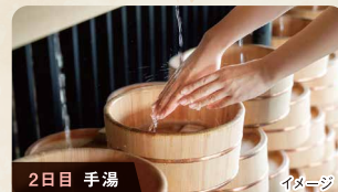
2日目 手湯 イメージ