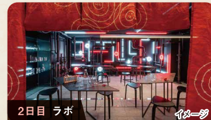
2日目 ラボ イメージ