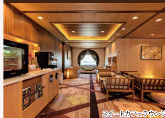
スイートカフェラウンジ

【設備】バスタブ(スイート船室のみ)・シャワー・トイレ・洗面台・テレビ・冷蔵庫・エアコン(個別)・電気ケトル・空気清浄機・ドライヤー