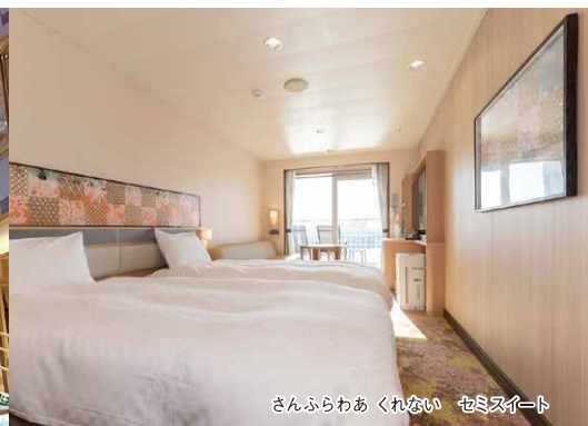
さんふらわあ くれない セミスイート