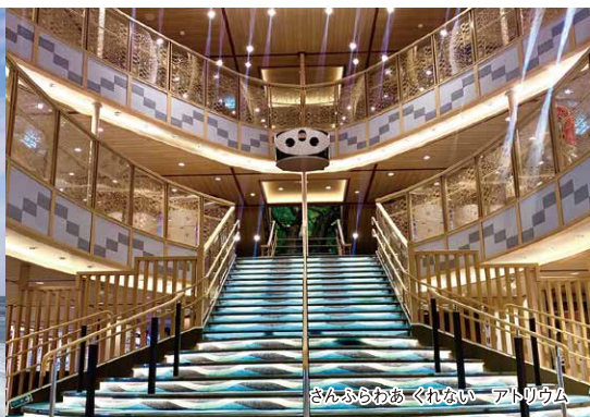
さんふらわあ くれない アトリウム