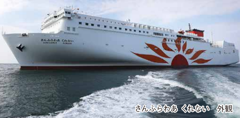
さんふらわあ くれない 外観

さんふらわあ くれない シップ・オブ・ザ・イヤー 2022 大型客船部門賞 受賞