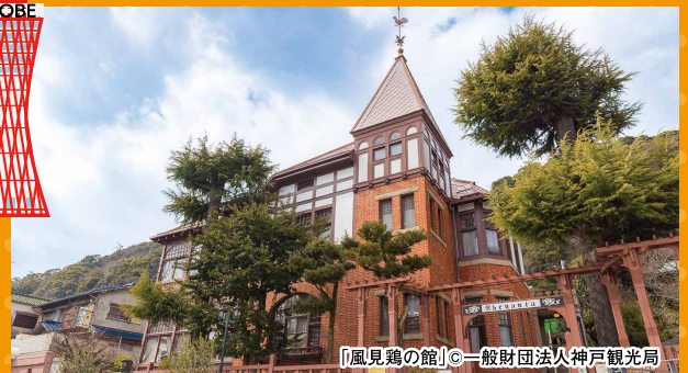
「風見鶏の館」