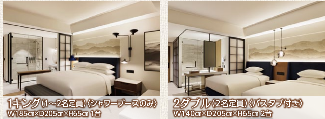
1キング(1~2名定員)(シャワーブースのみ) W185cm×D205cm×H65cm 1台