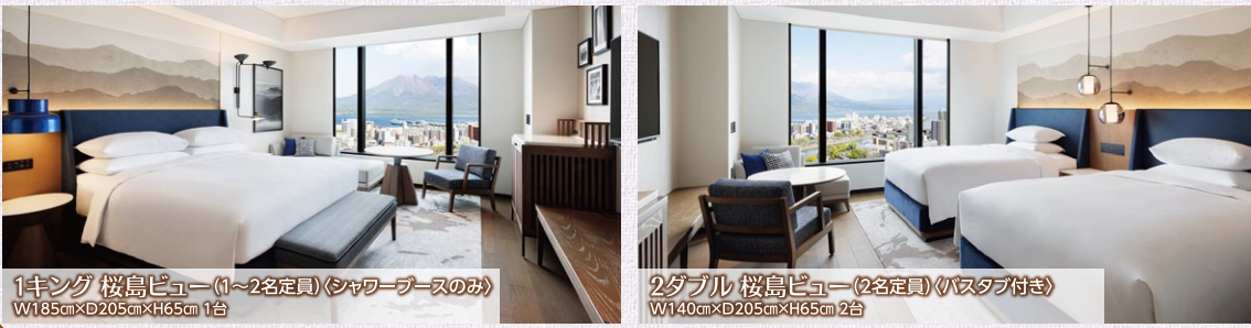
1キング 桜島ビュー(1~2名定員)(シャワーブースのみ) W185cm×D205cm×H65cm 1台