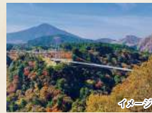
2日目 九重"夢"大吊橋