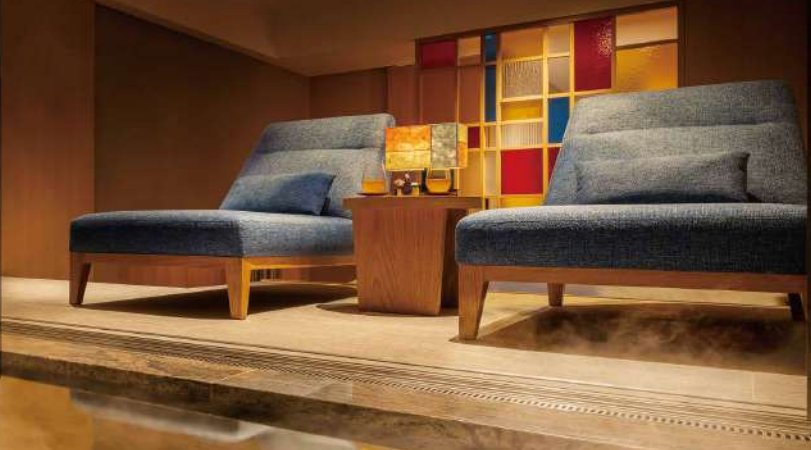
界雲仙 客室付き露天風呂イメージ