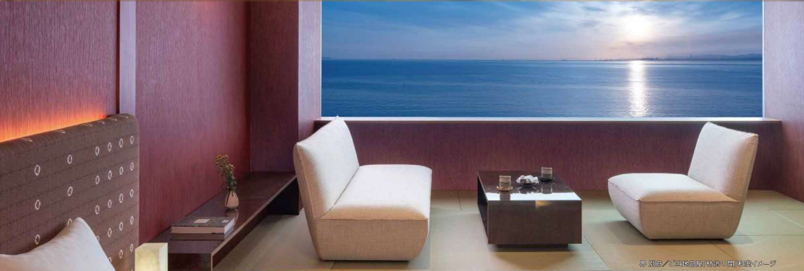
界別府/各当地部屋「柿渡の間」和室イメージ