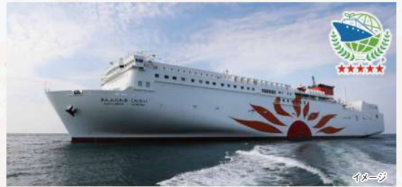
2023年1月より就航した「さんふらわあ くれないむらさき」は日本初のLNG燃料フェリーで、環境にやさしく静粛性も向上。

船やお宿、自然豊かな九州の絶景ポイントを巡りながら各所でEVの充電をする全走行距離が約490kmの4泊5日の宿泊プランです。おすすめの立ち寄りスポットや充電可能施設を掲載した「充電アシストマップ」で、EV長距離初心者でも安心な旅をご提案。カーボンニュートラルに配慮し、旅先の自然や文化に触れる"ecoで新しい旅"をお楽しみください。